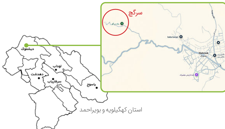
استان کهگیلویه و بویراحمد

سرگچ منطقه‌ای کوهستانی در استان کهگیلویه و بویراحمد است با فاصله خطی حدوداً ۳۶ کیلومتری از دیشموک و مسیر جاده‌ای حدوداً ۹۰ کیلومتری که خاکی، سنگلاخی و بسیار صعب‌العبور است و در زمستان احتمال انسداد کامل مسیر وجود دارد.