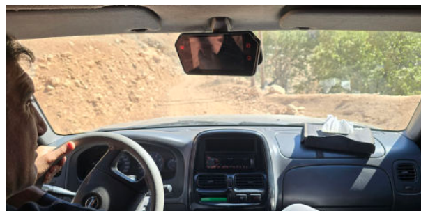
تنها یک جاده به روستا راه دارد که آن هم سنگلاخی و بسیار ناهموار است.

این روستا شامل دو بخش مجزا با ارتفاع متفاوت است که در مسیر آن دو رودخانه خروشان وجود دارد که سرچشمه رود جراحی است. فاصله رودخانه تا روستاها حدود ۵۰۰ تا ۷۰۰ متر است و اختلاف ارتفاع دو روستا با رودخانه بین ۳۰ تا ۱۵۰ متر.