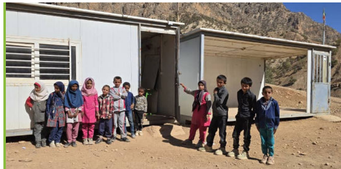
دبستان قدس سرگچ

روستای سرگچ دو مدرسه دارد که فاصله دو مدرسه از یکدیگر حدود ۳ کیلومتر است. مدرسه اول «قدس» نام دارد که مدرسه‌ای کانکسی است و حدود ۱۵۰ متر بالاتر از سطح رودخانه قرار دارد و مدرسه دوم با عنوان «شهید پرچی» حدود ۳۰۰ متر بالاتر از رودخانه است.