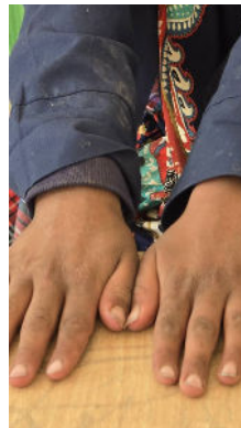
دستان پینه بسته دانش آموزان سرگچی